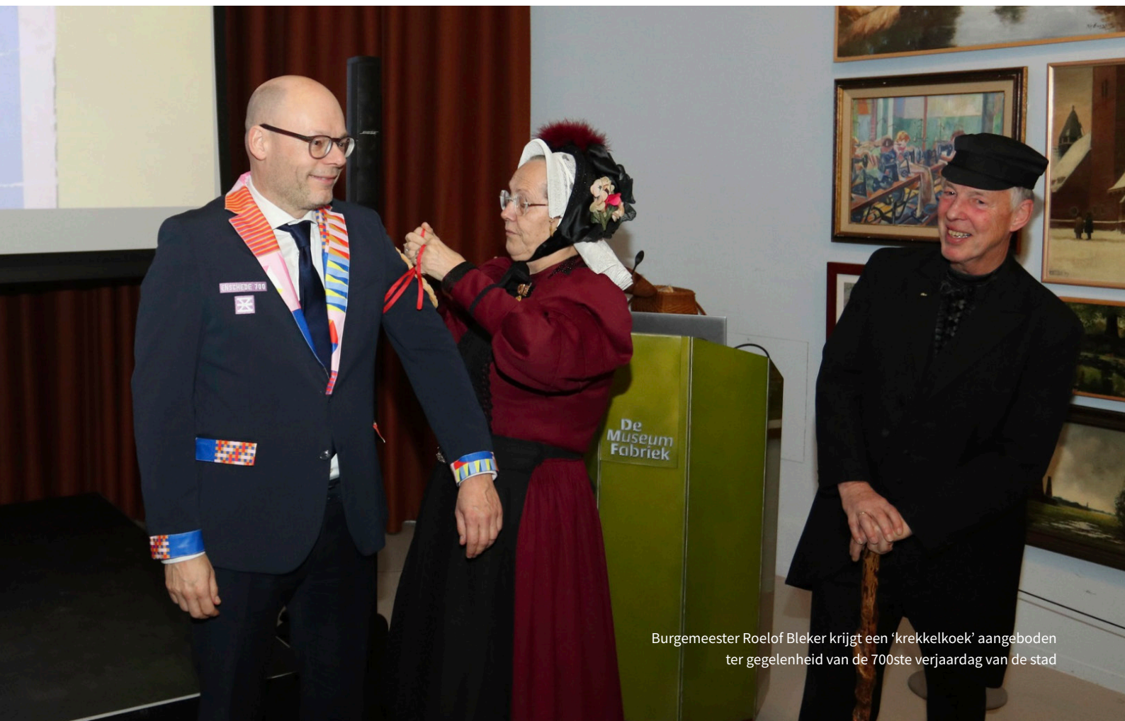
Burgemeester Roelof Bleker krijgt een 'krekkelkoek' aangeboden ter gelegenheid van de 700ste verjaardag van de stad

Met 1Twente werden in 2025 22 filmpjes opgenomen (en uitgezonden) voor de rubriek “In depot”, waarbij voorwerpen uit de collectie in hun historische en maatschappelijke context worden geplaatst en besproken. Deze films zijn te zien via het Youtubekanaal van de Atlas van Ooit en zijn waar mogelijk gekoppeld aan de voorwerpen die besproken worden. Samen met 1Twente zijn er nu totaal 164 uitzendingen gemaakt van deze rubriek.