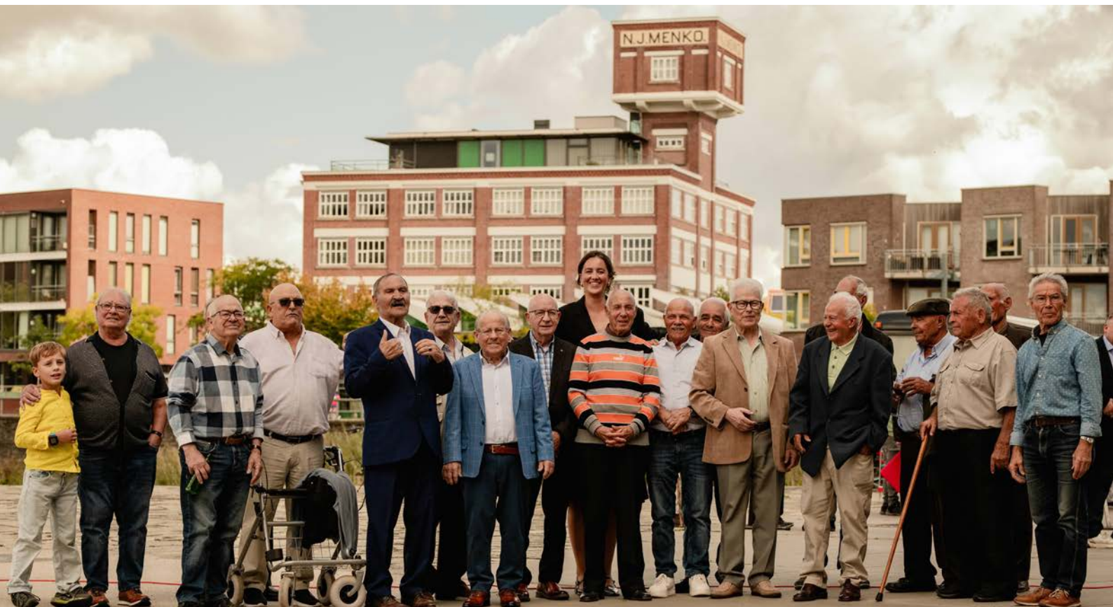
Fotograaf Olivia Tudor met Italiaanse arbeidsmigranten

Een bijzondere verrassing was het enorme succes van het textielatelier van De Museumfabriek, waar de conservator textiel Twentse zelfmaakmode verzamelde uit de jaren '50-'90. Zo werd nieuwe kennis over de textielgeschiedenis uit de regio vastgelegd. De verhalen over het maken en dragen van de kleding, compleet met foto's en emotionele herinneringen, zijn een waardevolle aanvulling op de collectie en een tastbare manier om de geschiedenis van de Twentse zelfmaakmode door te geven aan toekomstige generaties.